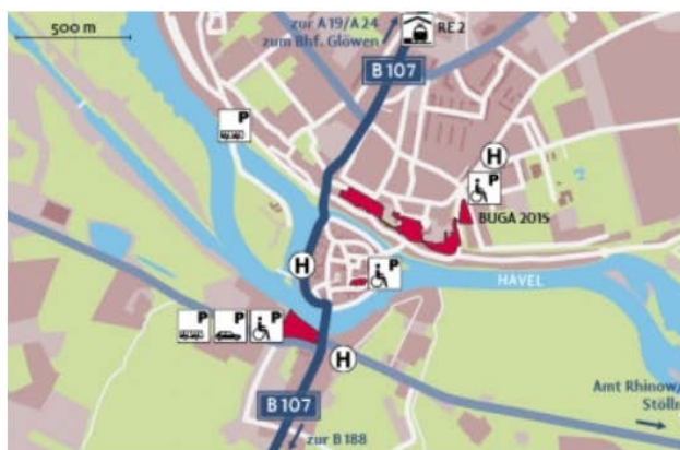
Anreise Hansestadt Havelberg